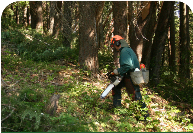
El terreno estaba empinado con muchos pinos muertos.