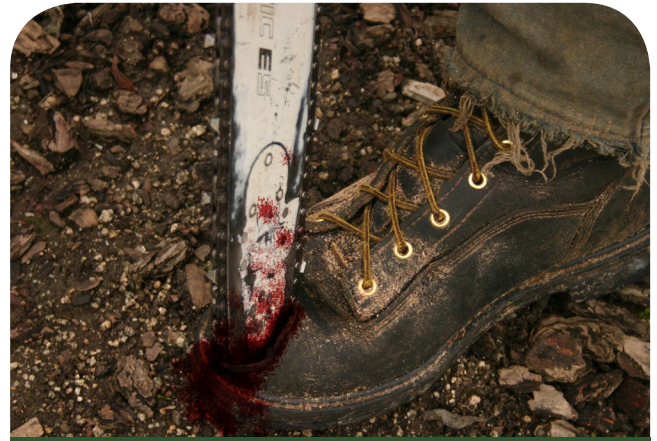
No podía ver muy bien. Me resbalé y solté la sierra y me corté el dedo del pie.