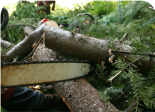
The saw jumped back on me and cut my head.