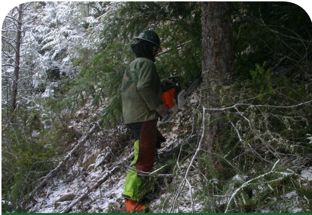
Comenzamos a trabajar alrededor de las seis de la mañana.