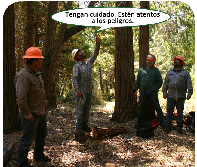
Tengan cuidado. Estén atentos a los peligros.