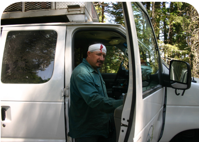
I was taken to the doctor by my supervisor about an hour later. They gave me 25 stitches.