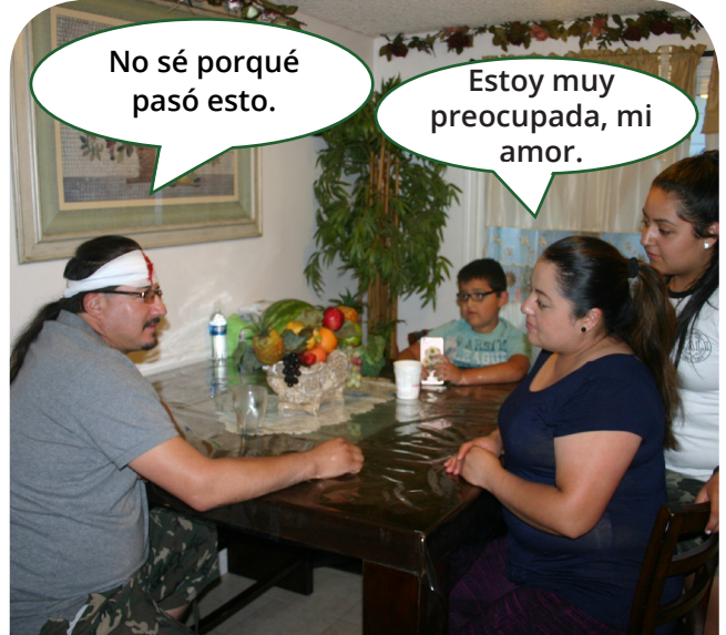
No sé por qué pasó esto.