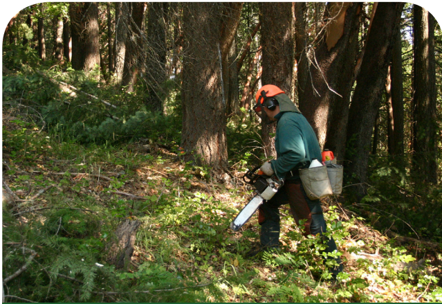
The terrain was steep, lots of dead pines.