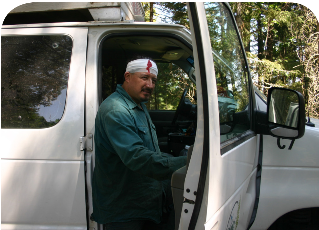
Aproximadamente una hora más tarde, mi supervisor me llevó con el doctor. Me dieron 25 puntadas.