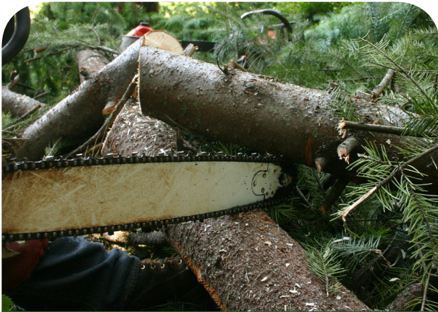
La motosierra rebotó hacia mí y me cortó en la cabeza.